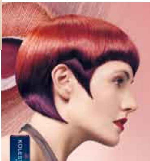
VIBRANT REDS Expressive und unverwechselbare Rottöne – von leuchtendem Kupfer bis zu aufregendem Violett.