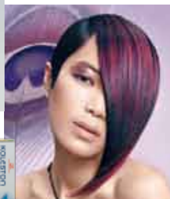
SPECIAL MIX Provokativ, kreativ und intensiv – für die ganz speziellen Farbkreationen.