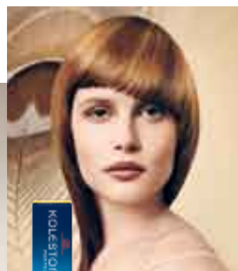
RICH NATURALS Natürlich aussehende Farben – mit raffinierten modischen Akzenten.