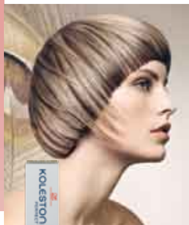
SPECIAL BLONDE Rein, ausdrucksstark und leuchtend – für klare, schimmernde Blondefekte.